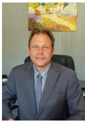
» lycée tenon

J'espère ainsi contribuer à ce que chacun d'eux se découvre voulu et créé par amour. Et que cet amour porte un nom : Jésus Christ.